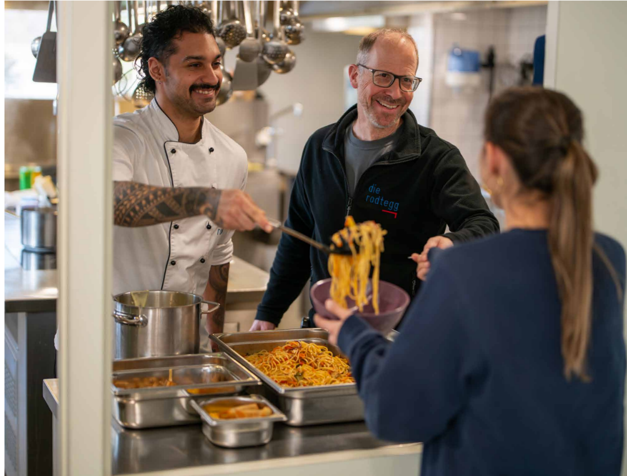
Eine Mitarbeiterin holt ein nicht verkauftes Menü aus der Küche ab und hilft so, Foodwaste zu reduzieren.

Die Gestaltung des Menüs, die Schulung der Mitarbeitenden, das richtige Zubereiten der Speisen und eine kurze Warmhaltezeit von maximal drei Stunden sind wichtige Faktoren.