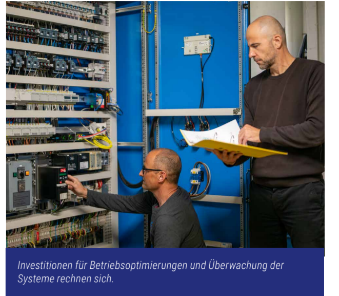
Investitionen für Betriebsoptimierungen und Überwachung der Systeme rechnen sich.

Was bisher durch Betriebsoptimierung erreicht werden konnte, ist weitgehend ausgeschöpft. Weitere Fortschritte sind nur noch mit baulichen Massnahmen möglich: zum Beispiel die energetische Sanierung der Gebäudehülle und der Dächer, den Umbau der Heizungsanlage oder den Ersatz der Heizungssteuerung.