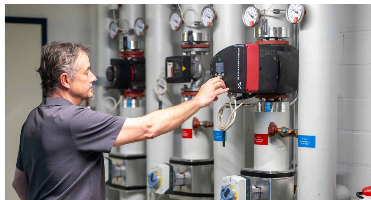
Die vielen unterschiedlichen Steuerungen haben grosse Auswirkung auf den Energieverbrauch.

Die Gesamtinvestitionen für Betriebsoptimierung, Beleuchtung und Motorenersatz (Lüftung, Umwälzpumpen) belaufen sich über zehn Jahre auf rund 240'000 Franken. Die Amortisation gelingt innerhalb des gleichen Zeitraums. Ab dann rechnet sich jede Kilowattstunde doppelt.