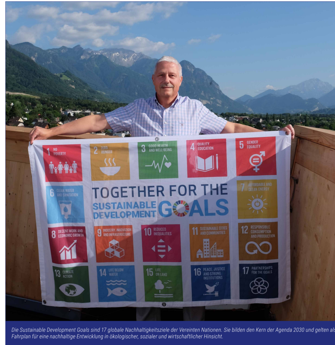
Die Sustainable Development Goals sind 17 globale Nachhaltigkeitsziele der Vereinten Nationen. Sie bilden den Kern der Agenda 2030 und gelten als Fahrplan für eine nachhaltige Entwicklung in ökologischer, sozialer und wirtschaftlicher Hinsicht.

Wenn wir das gemeinsam tun, dann haben unsere Urgrosskinder eine gute Zukunft. Sie werden uns dafür dankbar sein.